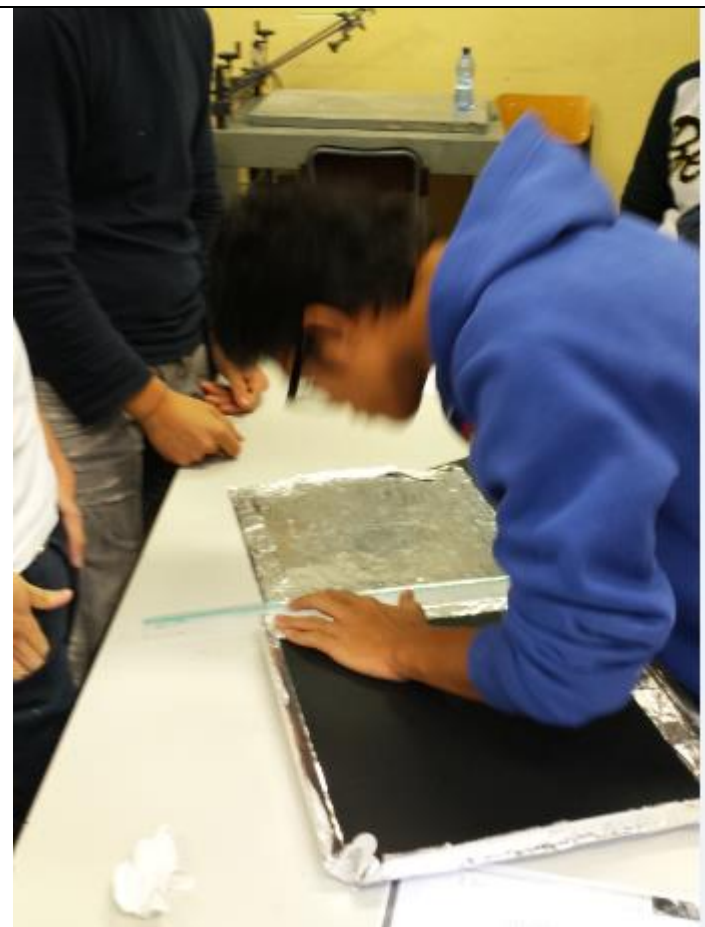
Costruzione di un forno Solare