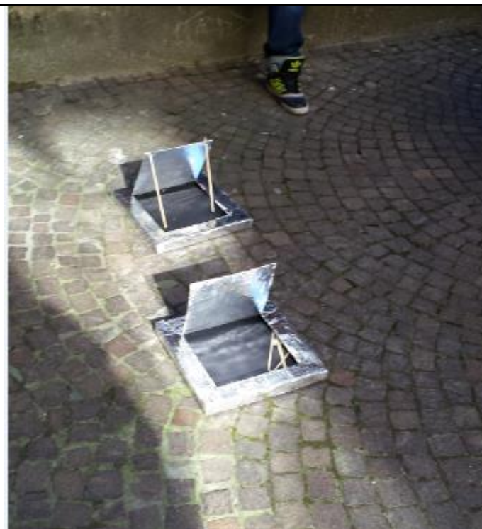
Funzionamento del forno solare