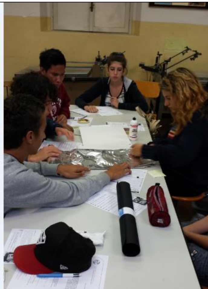
Costruzione di un forno Solare