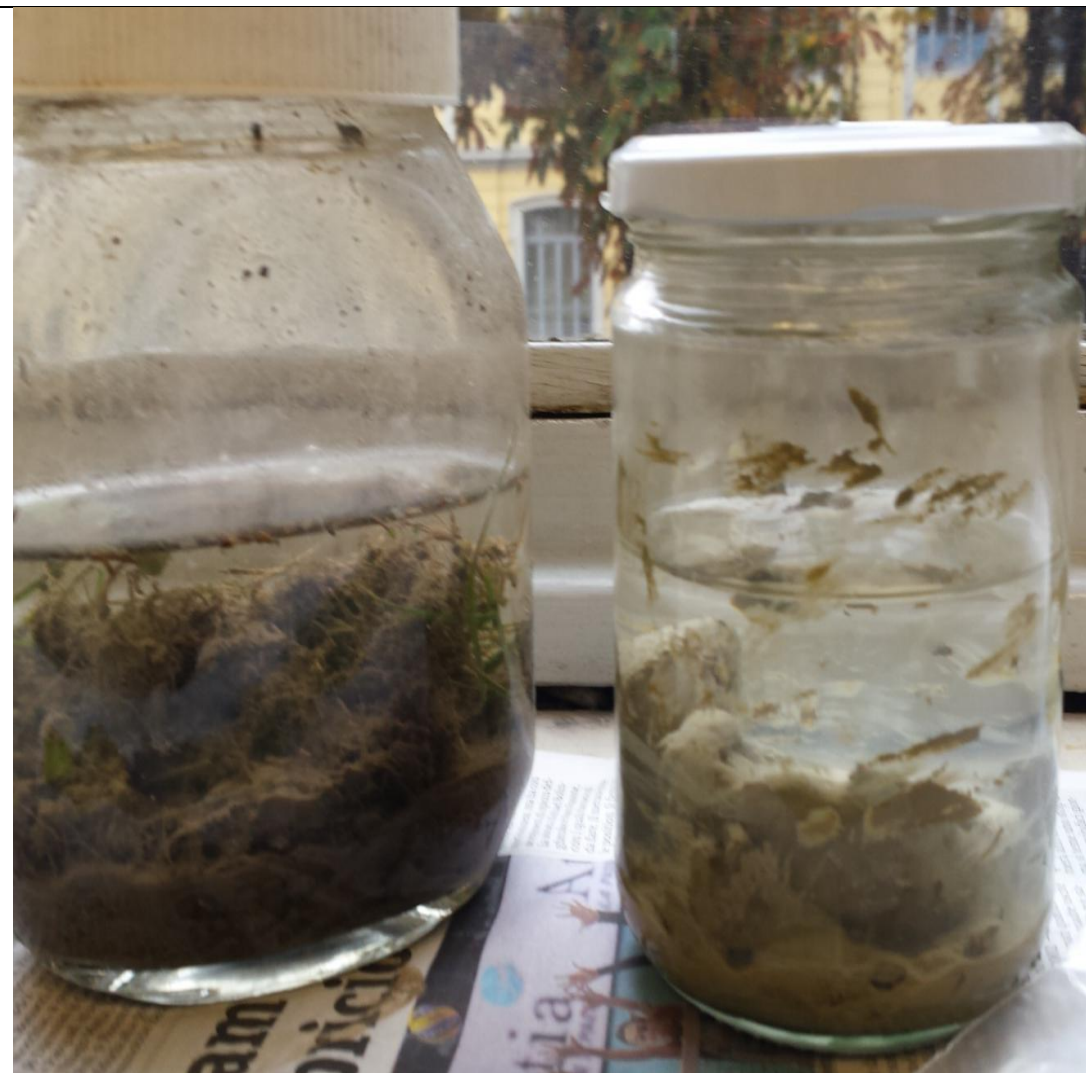
Risultato esperimento sulle varie parti del suolo